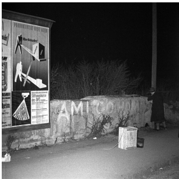
Abbildung 1) „Die Sowjetunion und der Friede“, März 1952, USIS, ÖNB/Wien, US 9921/7

lustrierten, ein zugespitzter ideologischer Kampf, eine Art sowjetisch-amerikanischer Schlagabtausch stattfand. Immer wieder wurde im Stadtraum die Parole „Ami go home“ angebracht.